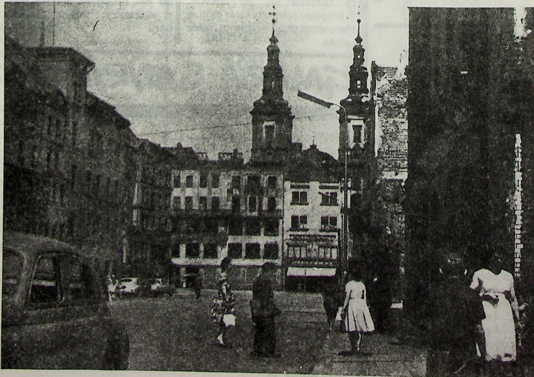
Legnica, 1957 r. Rynek