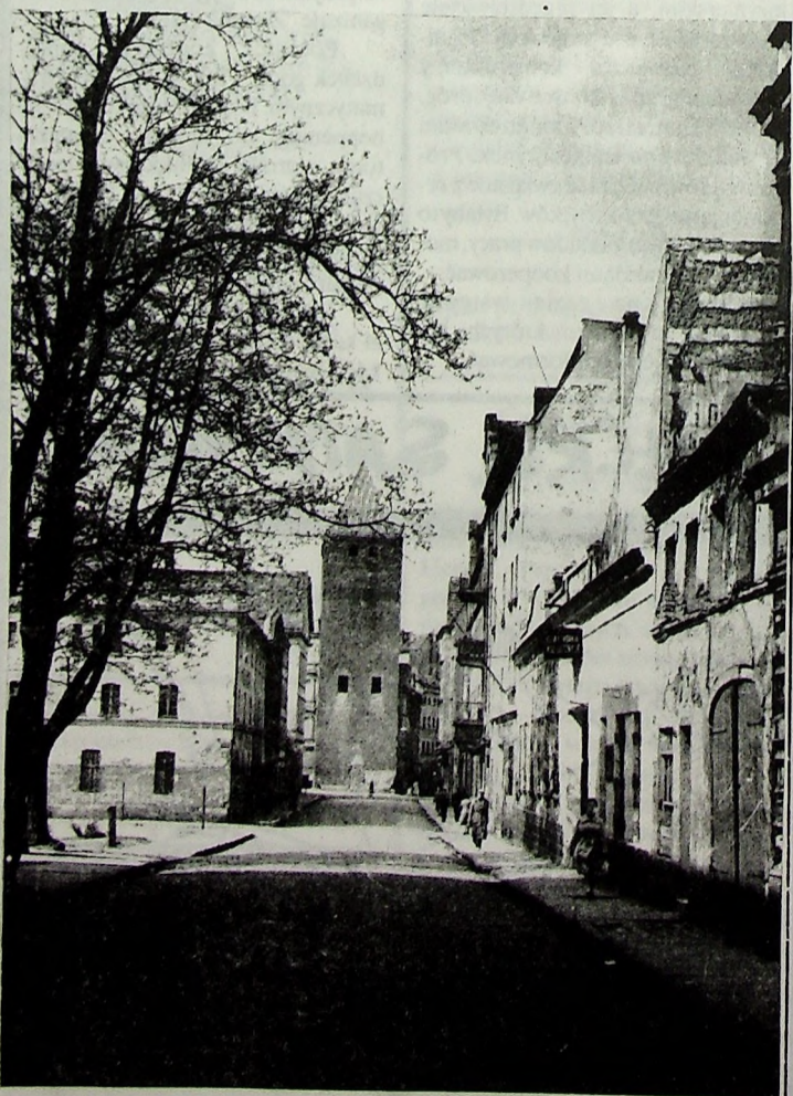
Legnica, 1955 ul. Gwarna