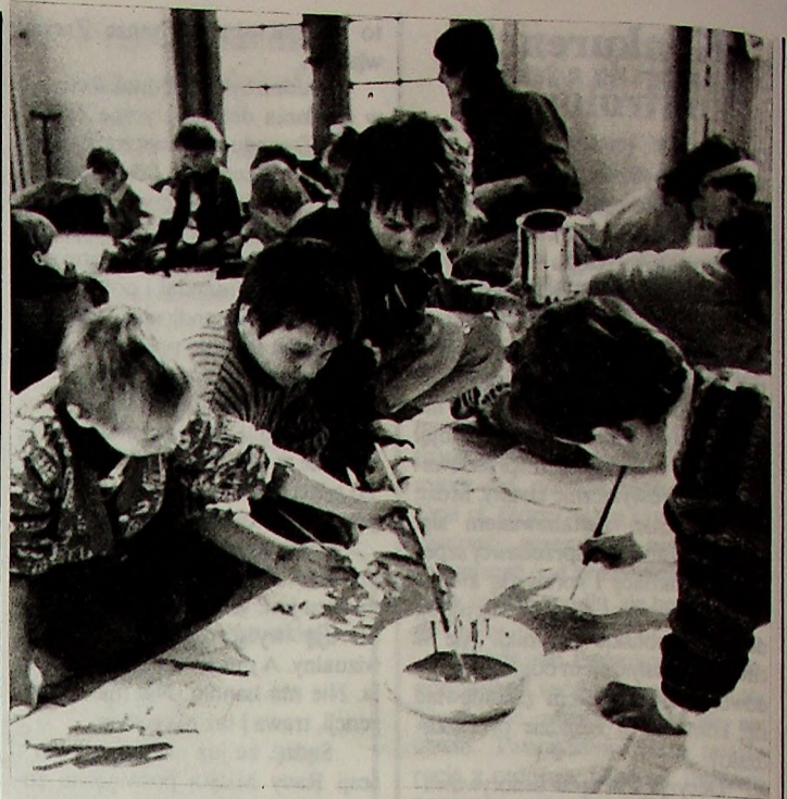
Wczoraj o 16.30 hall Teatru Dramatycznego zamienił się w olbrzymią pracownię plastyczną. W roli twórców wystąpiły dzieci z legnickich przedszkoli, które malowały przyrodę i zagrażające jej działania dorosłych.