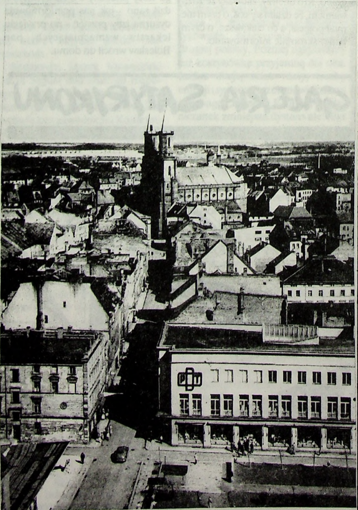
Legnica, 1965. Widok na Kościół Najśw. Marii Panny