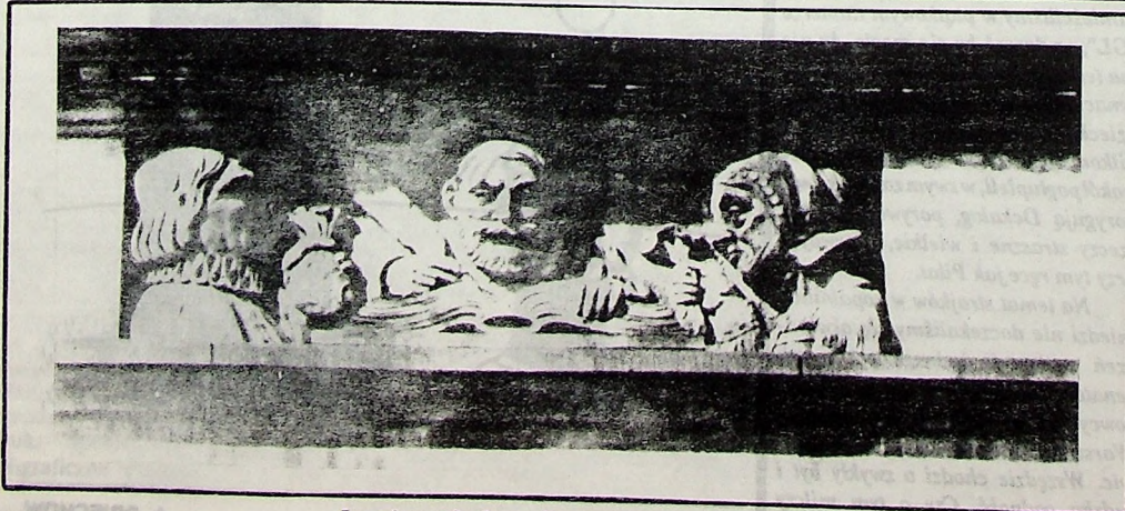
Legnica - płaskorzeźba na budynku Urzędu Miejskiego, od strony ul. Lenina.