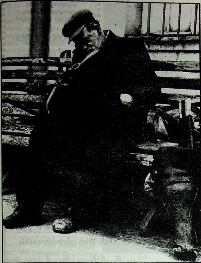
fol. P. Krzyżanowski