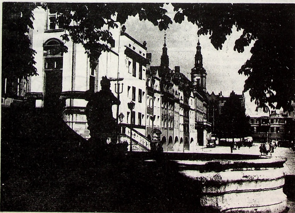
Legnica, 1960. Rynek z fontanną.