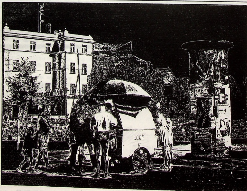
Legnica 1960 r. Pl. WILSONA