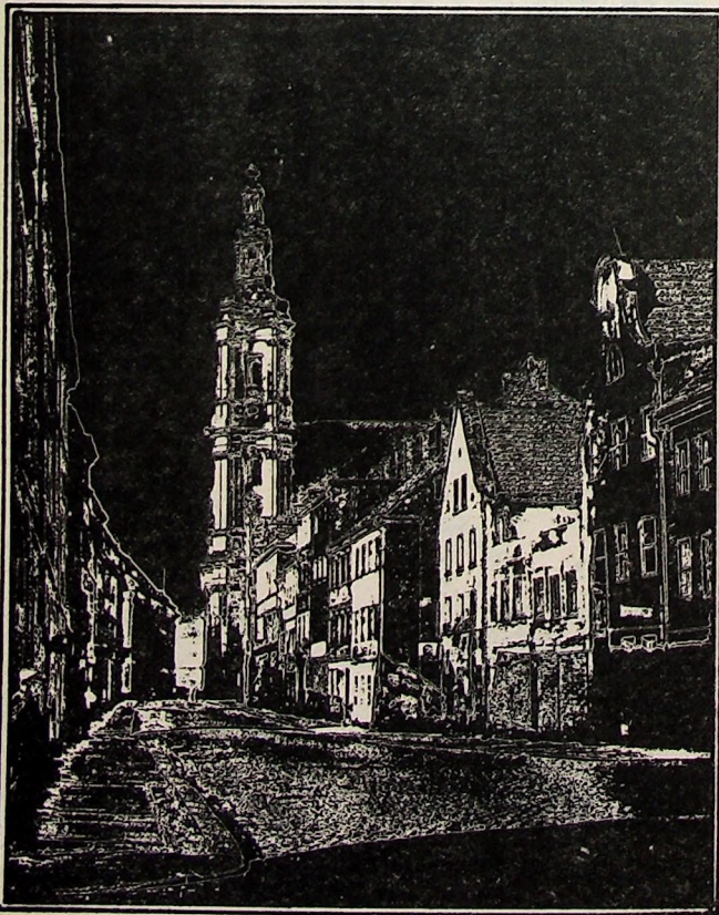
Legnica, 1960, ul. Partyzantów

Dawna Legnica w obiektywie Mieczysława Pawełka