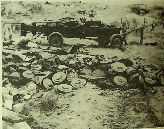
Obrazki z rosyjskiego poligonu w Trzebieiniu, na granicy województwa legnickiego i jeleniogórskiego. Na pierwszym, wśród porzuconych militariów widoczny jest portret byłego marszałka Związku Radzieckiego - Dmitrija Jazowa.

Drugie zdjęcie przedstawia naszych rodzimych poszukiwaczy łupów na pobojowisku Historii.