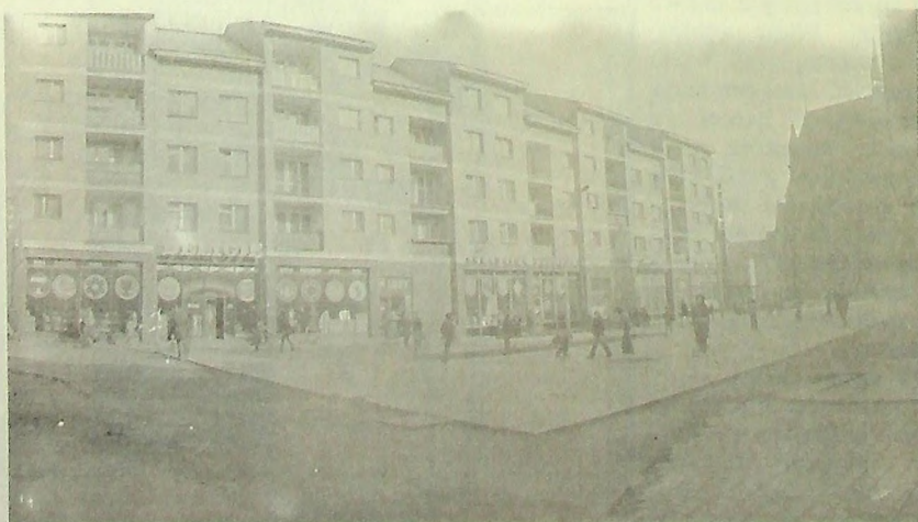
Legnica 1975, Rynek