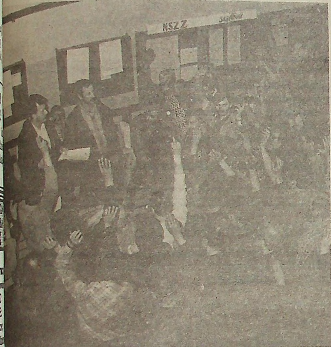
Ubiegłoroczny maj był na "miedzi" gorący. W tym roku zaczęto od studzenia emocji

Nr 76 (255) Rok II Czwartek, 16 kwietnia 1992 r. Cena 1000 zł.