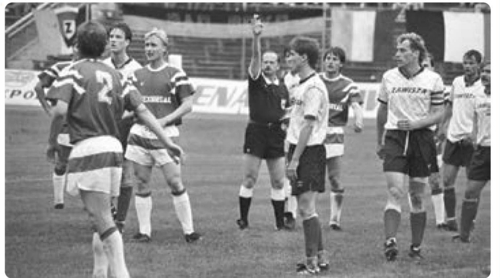
» 15 czerwca 1991 roku, stadion GOS, mecz Zagłębie Lubin – Zawisza Bydgoszcz.