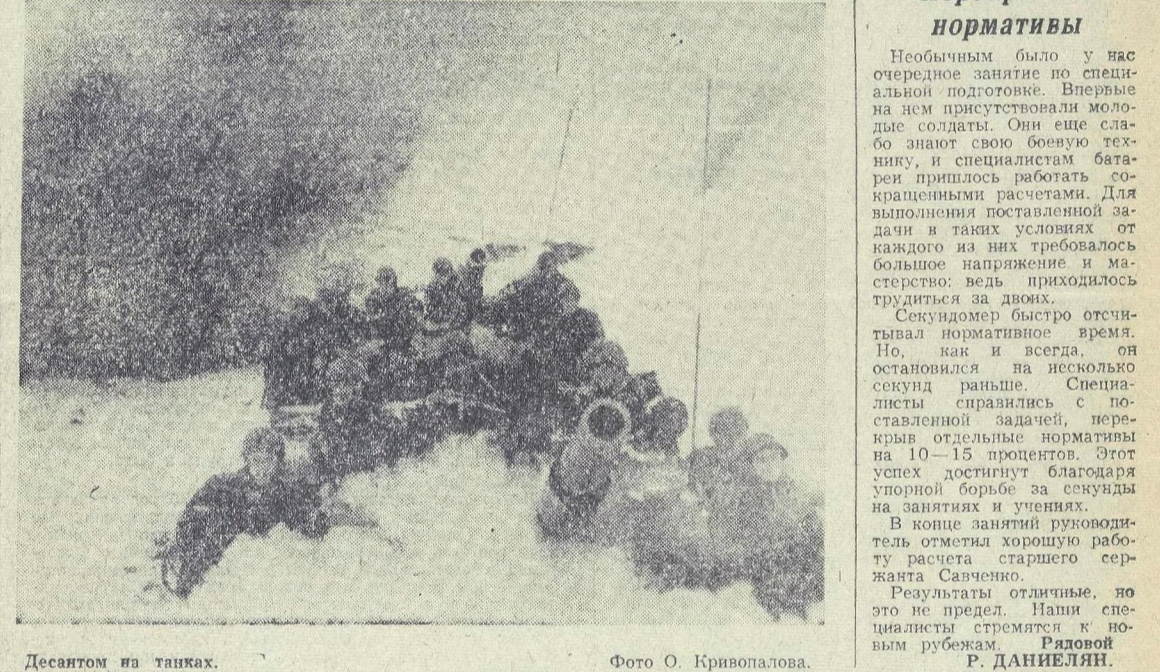
Десантом на танках.

Результаты отличные, но это не предел. Навыки специалистов к новым рубежам. Рядовой Р. ДАНИЕЛЯН.