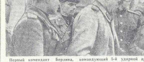
Первый командант Берлина, командующий 5-й ударной армией генерал-полковник Н. Э. БЕЗАРИН у здания рейхстага весной 1945 года.

Эта интересная форма работы нашла последователей и в соседних Онудийском и Усть-Коксинском районах. Детье участие в организации клубов ветеранов войны принимают сельские партийные и комсомольские организации и работники военных комиссариатов.