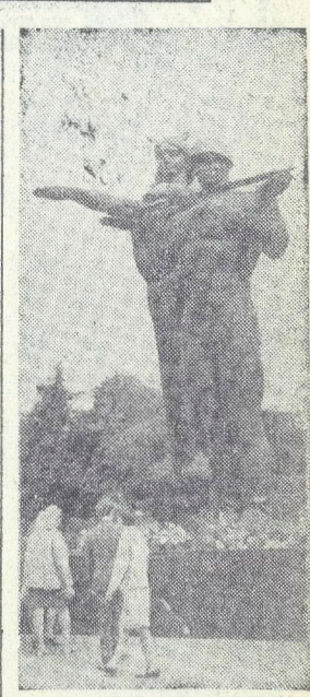
Львов. Монумент Славы Советской Армии.

На советско-германском фронте в течение 1941—1945 годов были сосредоточены