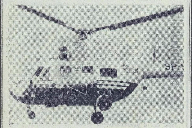
ПНР Вертолет Ми-2, выпускаемый Свидвинским заводом транспортных средств по советской лицензии в производстве в нескольких модификациях и поставляется в братские страны. Авиаторские школы Польши, созданное с братской помощью Советского Союза, является одной из наиболее молодых и интенсивно развивающихся отраслей польской промышленности.