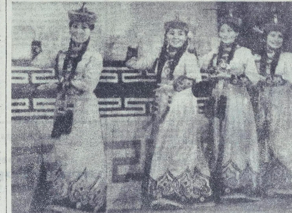
ТУВИНСКАЯ АССР Народный ансамбль «Саяны» — самый молодой театральный коллектив Тувы. Он создан в 1969 году. За это время его солисты дали более двух тысяч концертов и получили признание зрителей. На снимке: ансамбль «Саяны» исполняет вокально-хореографическую сюиту. Фото А. Полякова. (Фотохроника ТАСС).

В Донецком художественном музее открылась выставка произведений мастеров СССР и ГДР. За три года совместных творческих поездок на крупные предприятия и стройки, в колхозы и сельские кооперативы живописцы создали многочисленные полотна о жизни братских народов, об их дружбе и сотрудничестве. Значительную часть своих работ мастера двух стран посвятили Донбасу. (ТАСС).