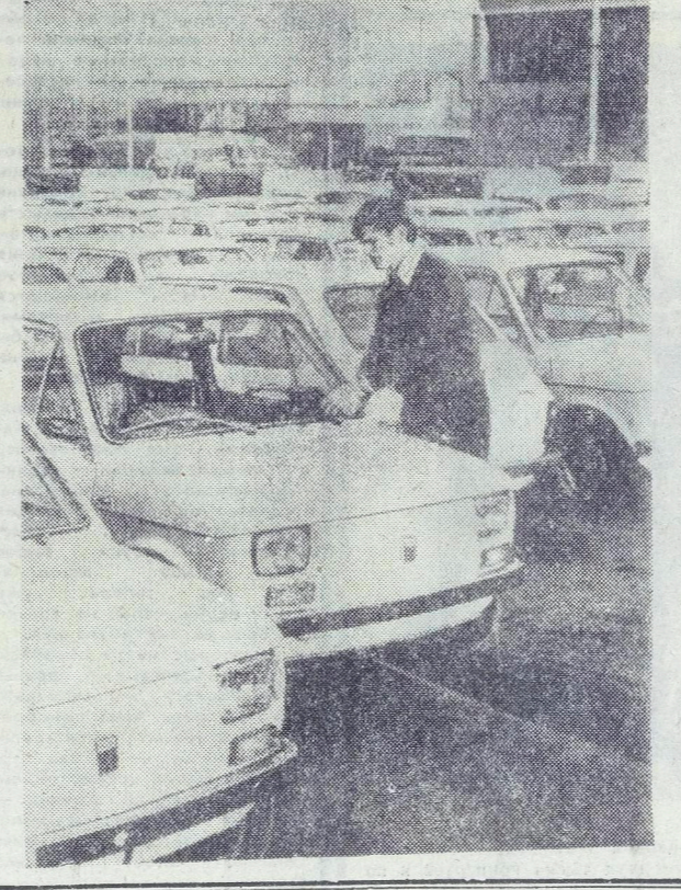
На снимке: автомобили готовы к отправке потребителям.

ЛОНДОН. 4 марта. (ТАСС). Премьер-министр Англии Г. Вильсон дал высокую оценку результатам переговоров в Москве с Генеральным секретарем ЦК КПСС Л. И. Брежневым и другими советскими руководителями. Выступая в Лондоне на промышленной выставке, Г. Вильсон подчеркнул, что отныне в отношениях между Англией и СССР создан новый политический климат, способствующий развитию двустороннего сотрудничества, в том числе и в