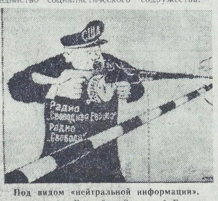
Под видом «нейтральной информации» «Вархалит, Западный Берлин».

На деньги, ассигнуемые конгрессом США (50 миллионов долларов в год), функционируют подпольные радиостанции «Свобода» и «Свободная Европа», которые с помощью лжи, клеветы, дезинформации вытесняют существующие идеологические диверсии против Советского Союза и других социалистических стран, расшатать политическое и моральное единство социалистического содружества.