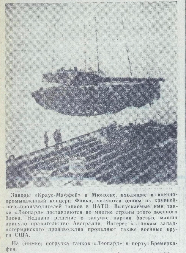
На снимке: погрузка танков «Леопард» в порту Бремерхафен. Фотохроника ТАСС.

Зам. ответственного редактора Б. Д. ПОПОВ. пансионат мамы. В ролях: П. Корюкин, Т. Карпов, Г. Федотова. Начало в 17.00. 19.00, 21.00. Большая кинопрограмма «Женщины Страны Советов». Документальный кинофильм «Марина Поповна». Начало в 21.00. КИНОТЕЛЕЦИОННЫЙ ЗАЛ. Для детей: вечерней художественный кинофильм «Корона Российской империи». 1 и 11 серии. Начало в 16.30. Более кинопрограмма «Боевые подвиги». Документальный кинофильм «Катюша» Художественный кинофильм «Последнее дело комиссара Берлаха». Производство Одесской киностудии. В последние минуты жизни большой комиссар полиции Берлах сумел разоблачить фашистского военного преступника, скрывающегося под именем одной из своих жертв. В ролях: Н. Симонов, А. Попов, Н. Волков, С. Коржков, Н. Гранько и другие. Начало в 19.00.