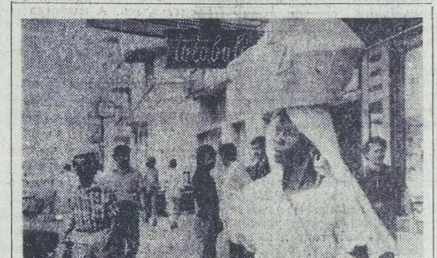
Создание переходного правительства в Анголе — важное событие в истории страны, положившее конец 500-летнему колониальному господству. До 11 ноября нынешнего года, когда Анголе будет предоставлена полная независимость, состоится выборы в учредительное собрание, которое разработает конституцию страны.

Каждое государство имеет право на мирное развитие своей экономики и культуры. Это право не должно быть ограничено никакими международными соглашениями, которые не способствуют развитию дружественных отношений и сотрудничеству между государствами и в укреплении мира во всем мире.