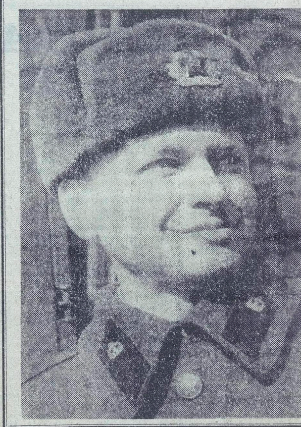
ВЕРНОСТЬ СОЛДАТСКОМУ ДОЛГУ

В своем выступлении по случаю 20-летия освоения целины Генеральный секретарь ЦК КПСС Леонид Ильич Брежнев подчеркивал: «Повышение ответственности, развитие инициативы, деловитости... воспитание сознательной дисциплины и нетерпимости к недостаткам — эти черты партийного стиля работы приобретают решающее значение». Этими выводами партии надо руководствоваться комсомольским активистам в повседневной, многогранной работе с армейской молодежью.