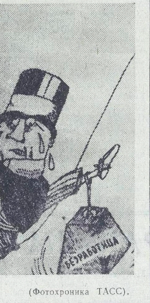
Рис. из газеты «Грама».

не бундесвера «эдебонно обращается к примерам воинской доблести в истории Германии, которые могут помочь воспитанию военнослужащих». При этом, присвоивший генеральский чин, выдающийся немецкий солдат времен второй мировой войны могут и должны служить для бундесвера образцом точно так же, как и военные деятели в другие периоды истории Германии: Де Мезьер и другие — западногерманские генералы (все они, как и большинство старших офицеров бундесвера, детски скажут, начинали карьеру в германском вермахте) — тем не отграничиваются. Как в 30 лет назад, они продолжают твердить свое: Гитлер, мол, злоупотребил добротами немецких военных, которые были рыцарями без страха и упрека, исполнявшими свой долг. Но исторически доказано, что немецкие генералы, служившие Гитлеру вплоть до беславленного конца рейха, полностью несут ответственность за военные преступления нацизма. Культ традиций гитлеров-