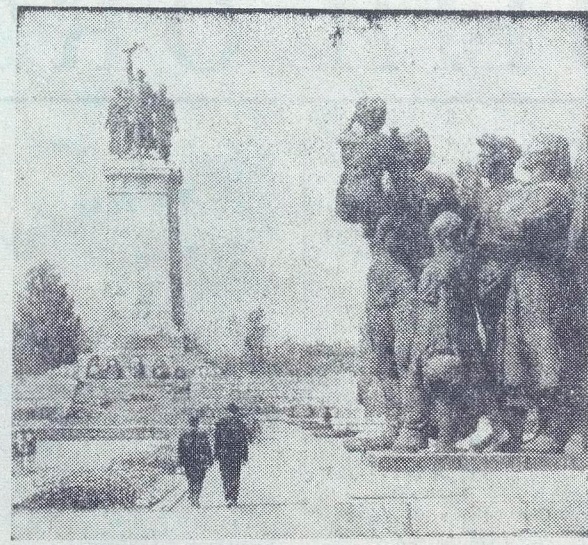
На снимке: монумент в честь Советской Армии-освободительницы, установленный в столице Народной Республики Болгарии — Софии.

Величественные подвиги народо-освободителей и его армии увековечены на болгарской земле в камне и бронзе. Но прежде чем рассказать об этих памятниках, я хочу вспомнить еще одну важную страницу в истории Болгарии. У Свиштова, на берегу Дуная, есть монумент, на котором высечены слова: «Русским