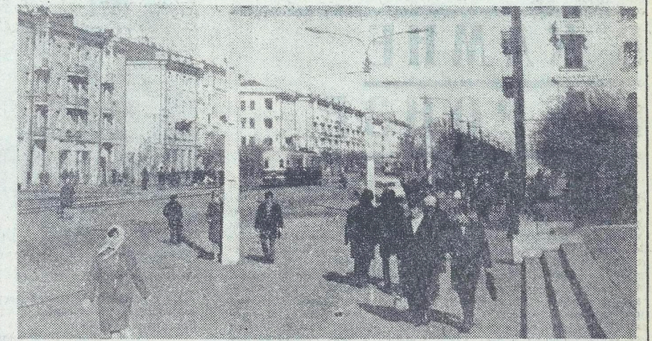
На снимке: Комсомольск-на-Амуре.

Крупного завода по сжижению газа, что обеспечит его поставку для местных нужд и на экспорт. Высококачественные коксующиеся угли Южно-Якутского угольного бассейна найдут широкое применение в качестве технологического топлива для Дальневосточного комбината черной металлургии и будут использованы на энергетические нужды Амурской области. Сельское хозяйство ориентируется на перспективном плане на максимальное обеспечение потребностей экономического района в таких продуктах, как картофель, овощи, молоко и мясо. Больше станет зерна и продукции птицеводства. Перспективный план развития производственных сил Дальнего Востока имеет самую непосредственную связь с дальнейшим ростом благосостояния трудящихся этого района. Разработаны комплексные мероприятия для создания наиболее благоприятных условий труда, жизни и быта дальневосточников.