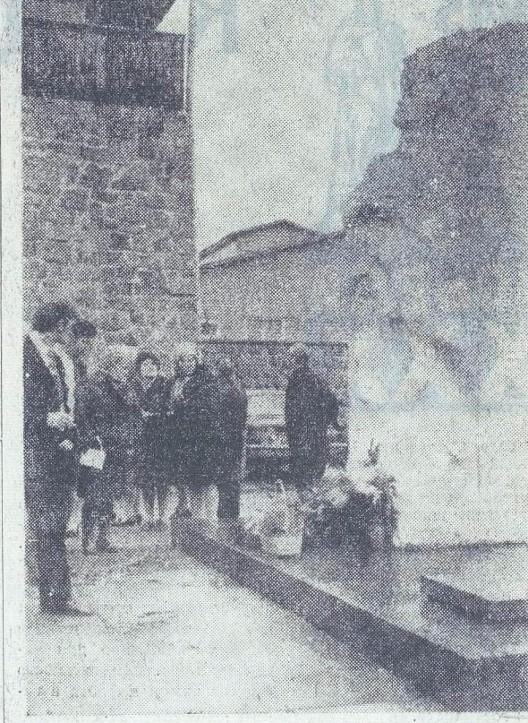
Всегда живые цветы у памятника Герою Советского Союза генералу Дмитрию Михайловичу Карбышеву, погибшему в концлагере Маутхаузен. На снимке: у памятника Д. М. Карбышеву.