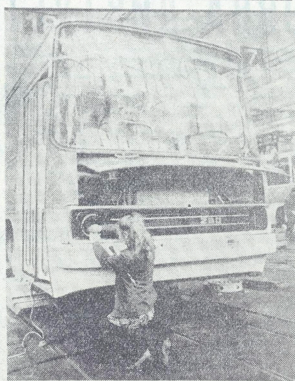
Будапештский автобусный завод «Икарус» в этом году значительно увеличил выпуск продукции. Коллектив предприятия добился больших успехов в социалистическом соревновании, разнернувшись в республике в честь XI съезда партии и 30-летия освобождения страны. С конвейера завода в нынешнем году должно сойти свыше 10 тысяч автобусов. Главными покупателями будут Советский Союз и ГДР. На снимке: «Икарус» из партии, предназначенной для СССР.