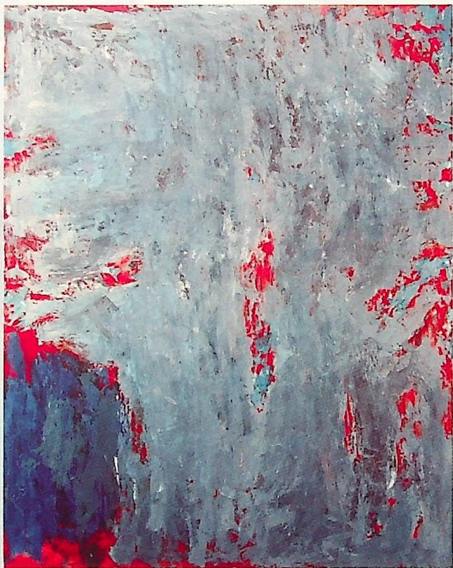
„...” - olej/plótno, 180x145 cm, 2003