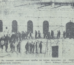
На снимке: заключенные арабы во время прогулки на территории Набусской тюрьмы.