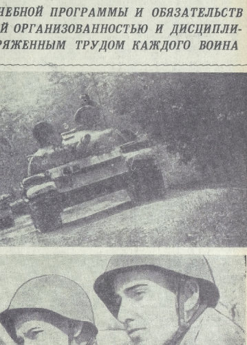
Портрет молодого человека в военной форме.