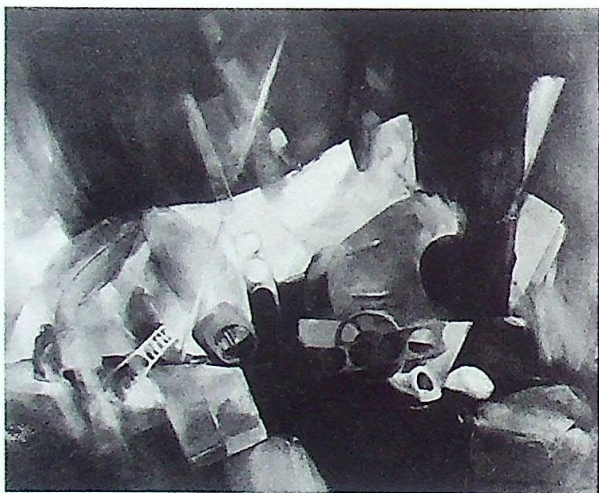
NIEBIESKA MARTWA NATURA Z DREWNI- KIEM (SILL LIFE WITH THE SHOES), 1983, 80x100 cm, olej/płótno

wydawca: Ośrodek Kultury „Wzgórze Zamkowe” w Lubinie