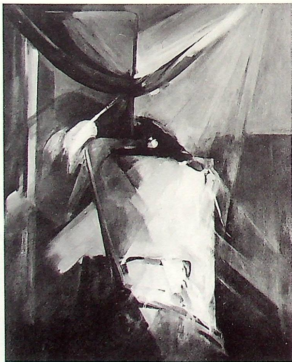
ZAPOMNIANE LALKI (FORGOTTEN DOLLS), 1985, 90x70 cm, olej/płótno

Uwielbiam zwyczajne przedmioty, zwłaszcza lustra i szkła. I have a passion for the ordinary... especially mirrors and crockery.